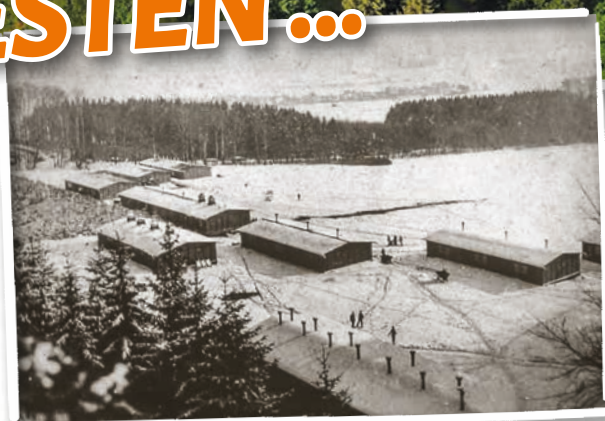
Das Gelände im Jahr 1945 - nur ein paar Baracken ...

Viele, viele Menschen waren hier angestellt oder haben ehrenamtlich mitgearbeitet, haben sich hier engagiert und sind dabei oft selbst reich gesegnet worden. Das ist das Schöne, an einem Dienst für den Herrn: