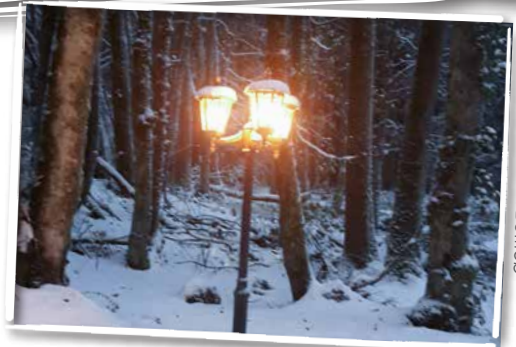
Die neue Wege-Beleuchtung auf dem Gelände ist im Betrieb