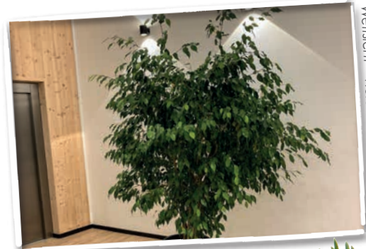
Ein Geschenk für unser Haus Weißt - vielen DANK!